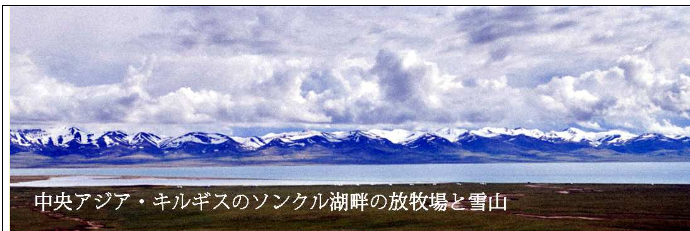
中央アジア・キルギスのソンケル湖畔の放牧場と雪山