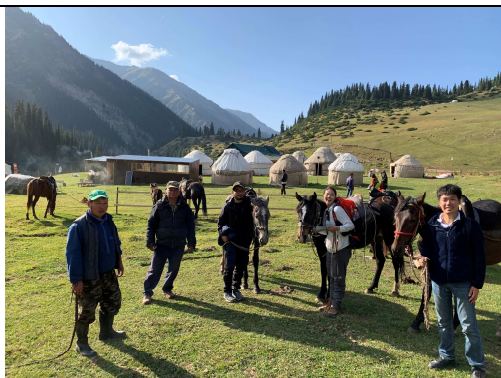
アルティン・アラシヤンの乗馬風景