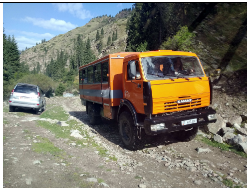
15～18人定員 アルティン・アラシヤンへのオフロード車