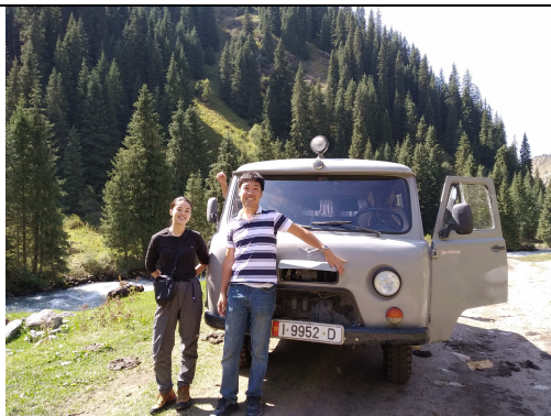
5～6人定員 アルティン・アラシヤンへのオフロード車