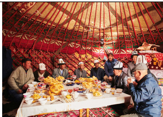
食事中のキルギスの村の風景